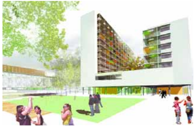
► "U2" (2º) Los dos bloques en los extremos de un paseo aportan perspectiva lineal. Los edificios son de dos cuerpos paralelos asimétricos, en continuidad con los bulevares, entre los que se organiza un espacio colectivo para residentes.

El concurso se convocó merced al convenio suscrito con el Ministerio de Vivienda para promover 500 viviendas de alquiler para universitarios, iniciativa enmarcada dentro del Plan de Vivienda 2005-2008.